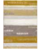
CARPET DREAMING 2 colors available Handwoven polypropylene heatset frisée e.g. 160 x 225 cm 199,00 Euro