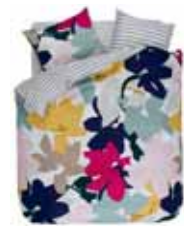
BED LINEN SERAI Printed cotton/sateen e.g. 135/200 cm + 80/80 69,95 Euro