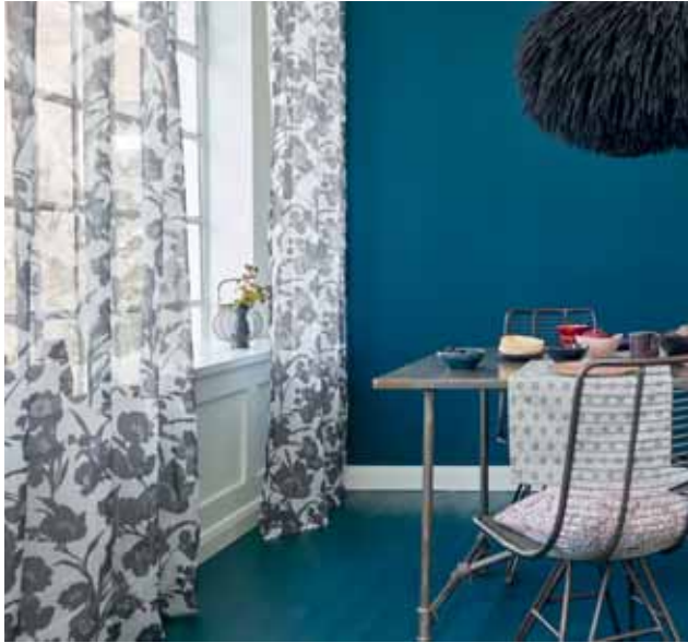
CURTAIN KELEA 140 x 250 cm € 39,99