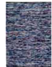
CARPET REFLECTION 2 colors available Handwoven wool/cotton e.g. 130 x 190 cm 509,00 Euro