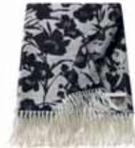
PLAID SILUETA 3 colors available Woven acrylic heatset frisé 150 x 200 cm 79,99 Euro