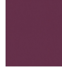
WALLPAPER FALL IN LOVE Solid in 4 colors Non-woven textile 0,53 x 10,05 m (5,33 qm) 21,95 Euro