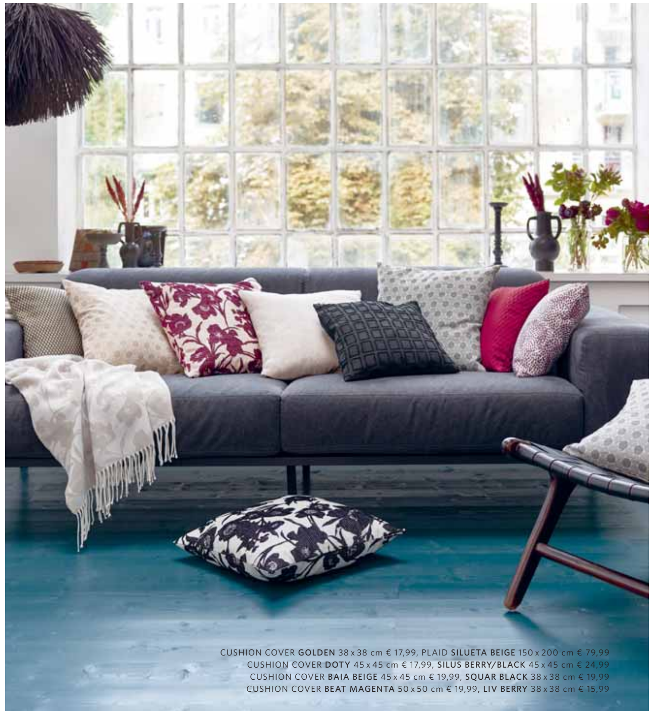
CUSHION COVER GOLDEN 38 x 38 cm € 17,99, PLAID SILUETA BEIGE 150 x 200 cm € 79,99 CUSHION COVER DOTY 45 x 45 cm € 17,99, SILUS BERRY/BLACK 45 x 45 cm € 24,99 CUSHION COVER BAIA BEIGE 45 x 45 cm € 19,99, SQUAR BLACK 38 x 38 cm € 19,99 CUSHION COVER BEAT MAGENTA 50 x 50 cm € 19,99, LIV BERRY 38 x 38 cm € 15,99