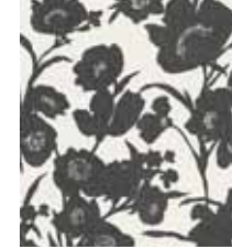
WALLPAPER FALL IN LOVE Flower design in 4 colors Non-woven textile 0,53 x 10,05 m (5,33 qm) 24,95 Euro