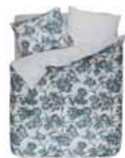
BED LINEN ARAI Digital print with piping Cotton/sateen e.g. 135/200 cm + 80/80 79,95 Euro