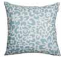
CUSHION LEO 3 colors available Digital printed microfiber 45 x 45 cm 19,99 Euro