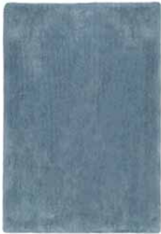
CARPET RELAXX 160x230 cm € 299,00