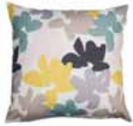
CUSHION WINTER Digital printed canvas 48 x 48 cm 19,99 Euro

All prices in this brochure are German recommended retail prices and may vary from country to country.