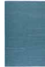
KELIM RAINBOW 13 colors available Handwoven 100% cotton e.g. 160 x 230 cm 399,00 Euro