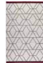
CARPET HEXAGON Handwoven wool/cotton e.g. 160 x 230 cm 659,00 Euro