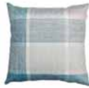
CUSHION SQUARED Digital printed microfiber 45 x 45 cm 24,99 Euro