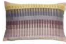
CUSHION TRIO Jacquard design 38 x 58 cm 24,99 Euro