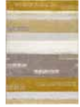
CARPET DREAMING 2 colors available Handwoven polypropylene heatset frisée e.g. 160 x 225 cm 199,00 Euro