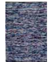
CARPET REFLECTION 2 colors available Handwoven wool/cotton e.g. 130 x 190 cm 509,00 Euro