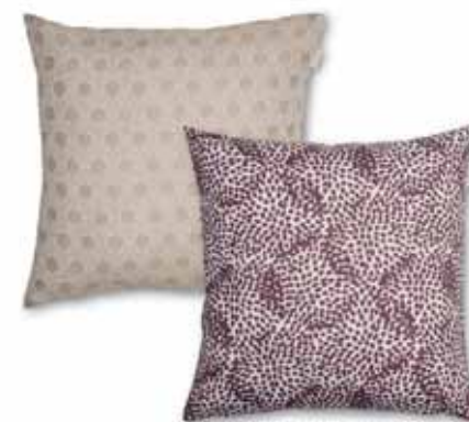
CUSHION COVER DOTY 45 x 45 cm € 17,99 CUSHION COVER LIV 38 x 38 cm € 15,99