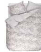
BED LINEN KRISA 2 colors available Printed cotton/sateen e.g. 135/200 cm + 80/80 69,95 Euro