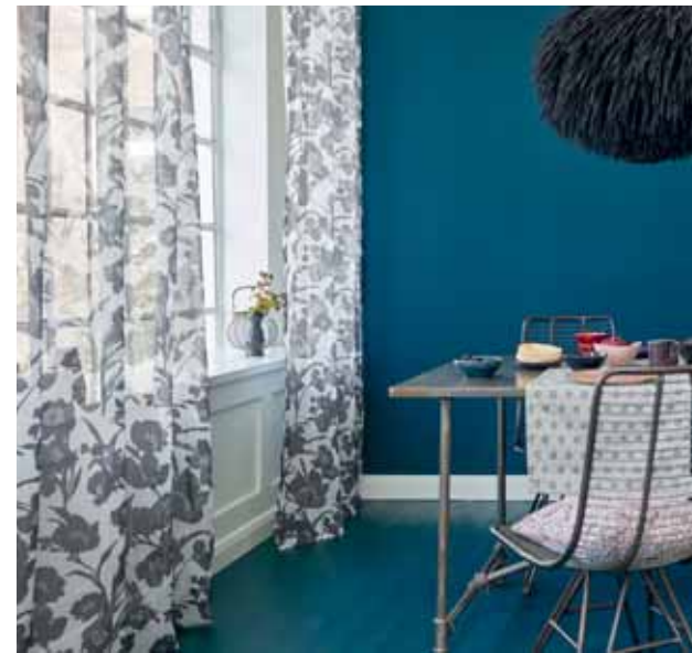
CURTAIN KELEA 140 x 250 cm € 39,99