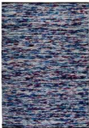
CARPET REFLECTION 130 x 190 cm € 509,00