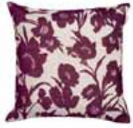
CUSHION SILUS 3 colors available Woven jacquard design 45 x 45 cm 24,99 Euro

All prices in this brochure are German recommended retail prices and may vary from country to country.