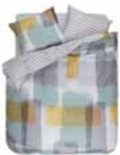
BED LINEN MAKIA Printed cotton/sateen e.g. 135/200 cm + 80/80 69,95 Euro