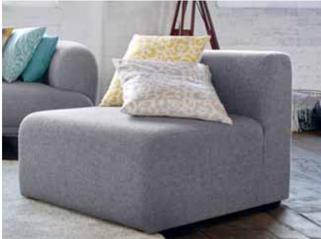
CUSHION COVERS LEO 45x45 cm € 19,99