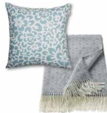
PLAID DORO 150 x 180 cm € 49,99 CUSHION COVER LEO 45 x 45 cm € 19,99