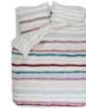
BED LINEN LAURE Digital print flannel e.g. 135/200 cm + 80/80 49,95 Euro