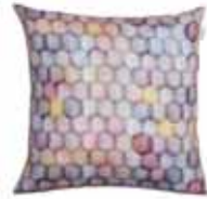
CUSHION SIO Digital printed canvas 48 x 48 cm 19,99 Euro