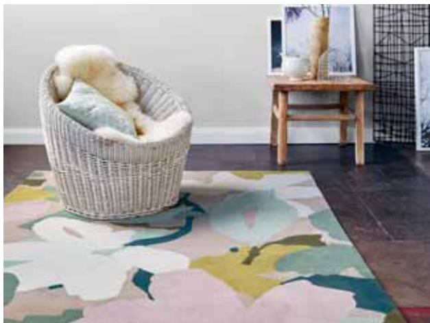
CARPET BLOOM 170 x 240 cm € 979,00