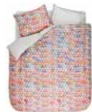
BED LINEN SIO Digital print with piping Cotton/sateen e.g. 135/200 cm + 80/80 79,95 Euro