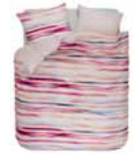
BED LINEN MANGE 2 colors available digital printed cotton/sateen e.g. 135/200 cm + 80/80 69,95 Euro