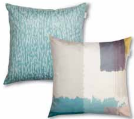
CUSHION COVER LAGO 45 x 45 cm € 24,99 CUSHION COVER BRUSHED 45 x 45 cm € 24,99