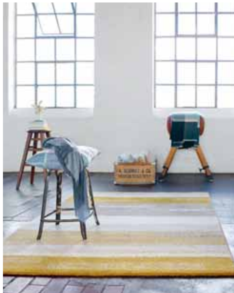
CARPET DREAMING 200 x 290 cm € 319,00