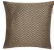
CUSHION GOLDEN Woven jacquard design 38 x 38 cm 17,99 Euro