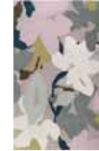
CARPET BLOOM New Zealand wool Handtufted e.g. 170 x 240 cm 979,00 Euro