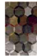
CARPET MODERNINA Handwoven polypropylen heatset frisé e.g. 160 x 225 cm 199,00 Euro