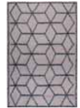
CARPET FIESTA 2 colors available Handwoven wool cotton e.g. 160 x 230 cm 659,00 Euro