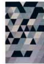
KELIM TRIANGLE 2 colors available Handwoven 100% cotton e.g. 160 x 230 cm 589,00 Euro