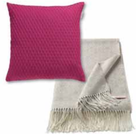
PLAID DORO 150 x 180 cm € 49,99 CUSHION COVER BEAT 45 x 45 cm € 15,99