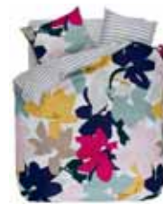
BED LINEN SERAI Printed cotton/sateen e.g. 135/200 cm + 80/80 69,95 Euro