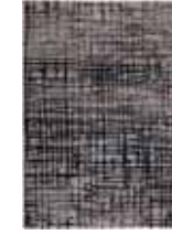
CARPET VELVET GRID Machinewoven in Turkey e.g. 160 x 225 cm 269,00 Euro