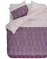
BED LINEN TAMO 2 colors available Printed cotton flannel e.g. 135/200 cm + 80/80 49,95 Euro