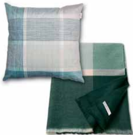
PLAID CARO 150 x 200 cm € 79,99 CUSHION COVER SQUARED 45 x 45 cm € 24,99