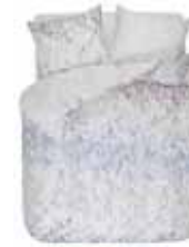
BED LINEN LAGAI Printed cotton/sateen e.g. 135/200 cm + 80/80 69,95 Euro