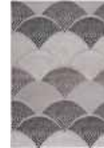
CARPET CHIMERA 2 colors available Handwoven 100% cotton e.g. 160 x 230 cm 269,00 Euro