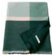
PLAID CARO Woven acrylic 150 x 200 cm 79,99 Euro