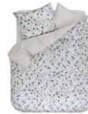
BED LINEN DARIA Digital printed cotton/sateen e.g. 135/200 cm + 80/80 79,95 Euro