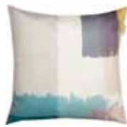
CUSHION BRUSHED Digital printed microfiber 45 x 45 cm 24,99 Euro