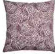
CUSHION LIV 4 colors available Woven jacquard design 38 x 38 cm 15,99 Euro