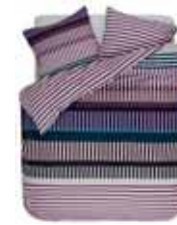
BED LINEN NAMPA 2 colors available Printed cotton flannel e.g. 135/200 cm + 80/80 49,95 Euro