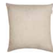
CUSHION BAIA 3 colors available Woven material 45 x 45 cm 19,99 Euro