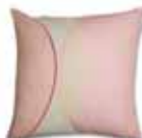
Cushion Tavai 2 colors available 45 x 45 cm 22,99 Euro