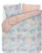
Bed linen Heras 2 colors available 100% cotton/sateen e.g. 69,95 Euro