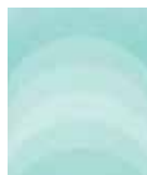
Wallpaper Cool Noon 0,53 x 10 m 29,95 Euro