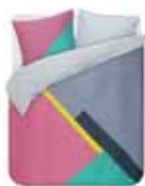
Bed linen Xaz 100% cotton/sateen e.g. 79,95 Euro