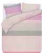
Bed linen Makon 2 colors available 100% cotton/percale e.g. 49,95 Euro