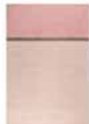
Calippo Kelim 3 sizes available e.g. 80 x 150 cm 129,00 Euro