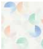
Wallpaper Morning Blush 0,53 x 10 m 41,95 Euro