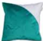
Cushion Corro 2 colors available 38 x 38 cm 22,99 Euro