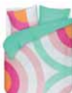
Bed linen Kio 100% cotton/sateen e.g. 79,95 Euro