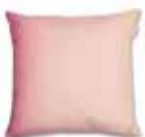
Cushion Punti 2 colors available 38 x 38 cm 19,99 Euro