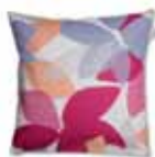
Cushion Aleza 2 colors available 45 x 45 cm 19,99 Euro