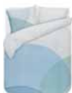
Bed linen Tavai 100% cotton/sateen e.g. 69,95 Euro