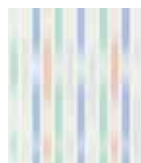
Wallpaper Morning Blush 0,53 x 10 m 41,95 Euro