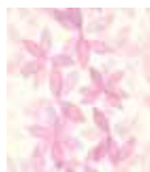
Wallpaper Cool Noon 0,53 x 10 m 29,95 Euro